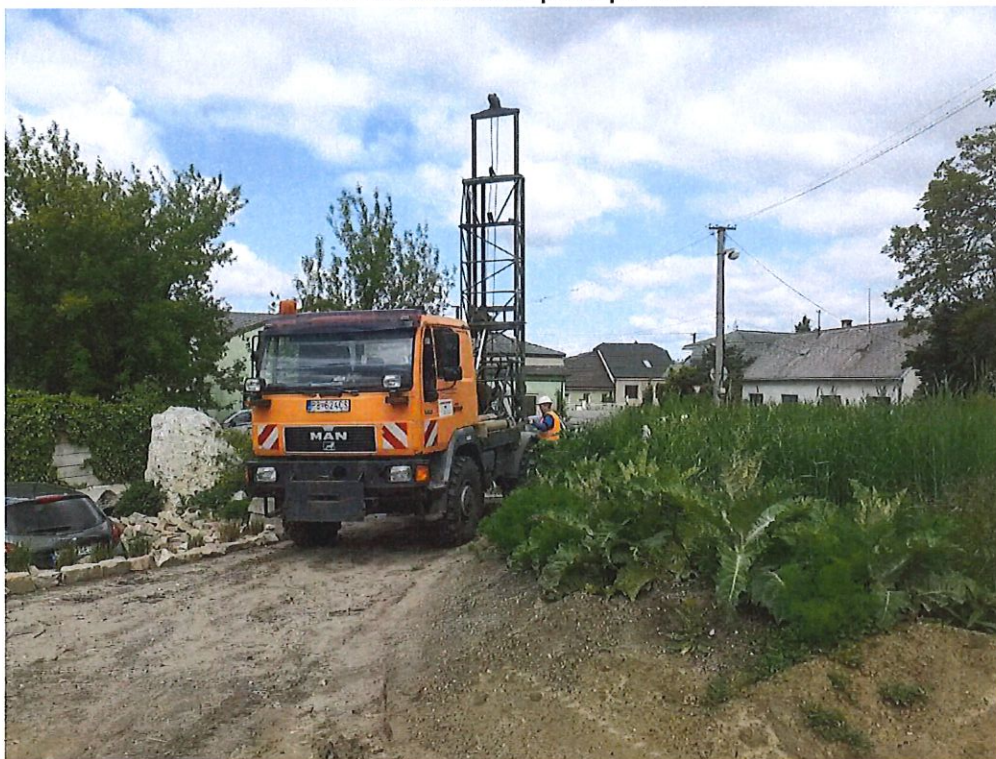
D 115 - podjazd pri HaZZ, šžkm 23,978