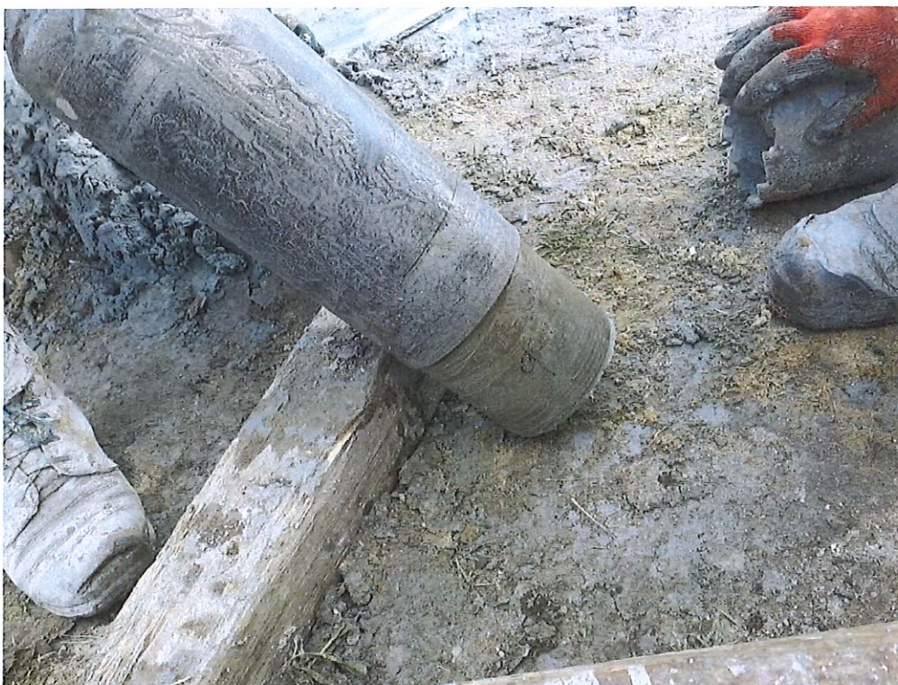
D 123 - odber neporušených vzoriek