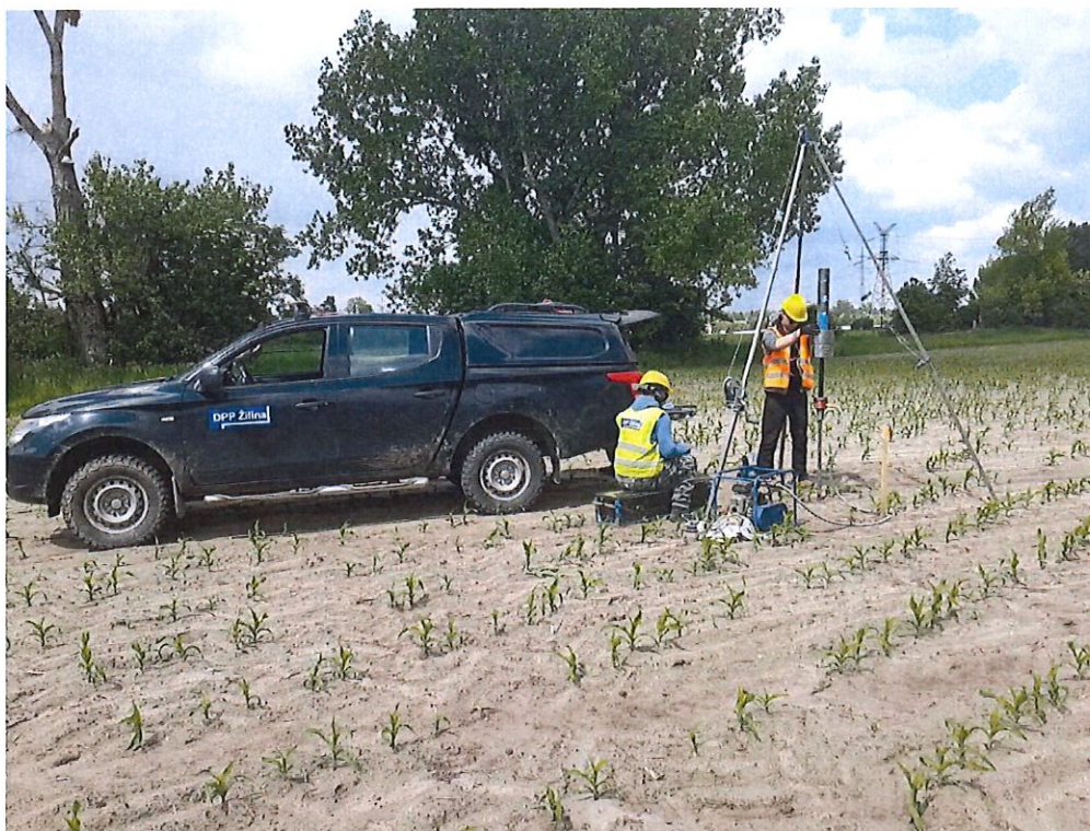
DPT 23 - žel. st. Zohor, sžkm 12,880