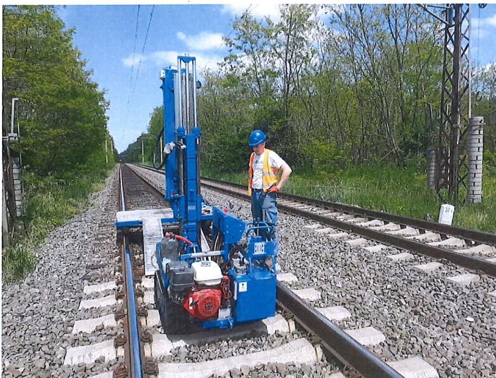
DPT 196 - Zohor - Malacky, sžkm 20,400